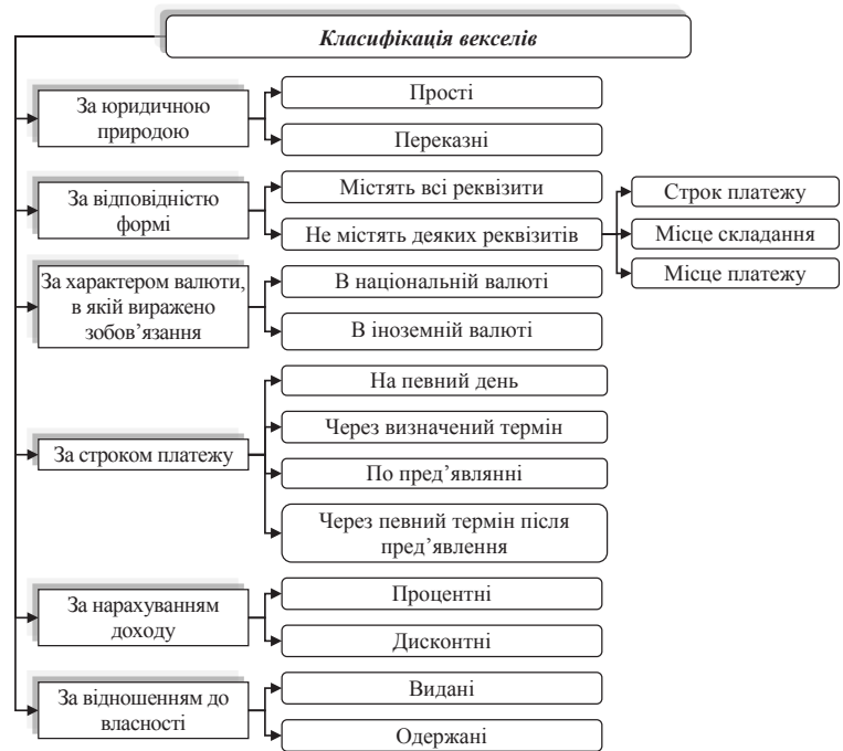
Рис. 4. Узагальнена класифікація векселів для цілей бухгалтерського обліку