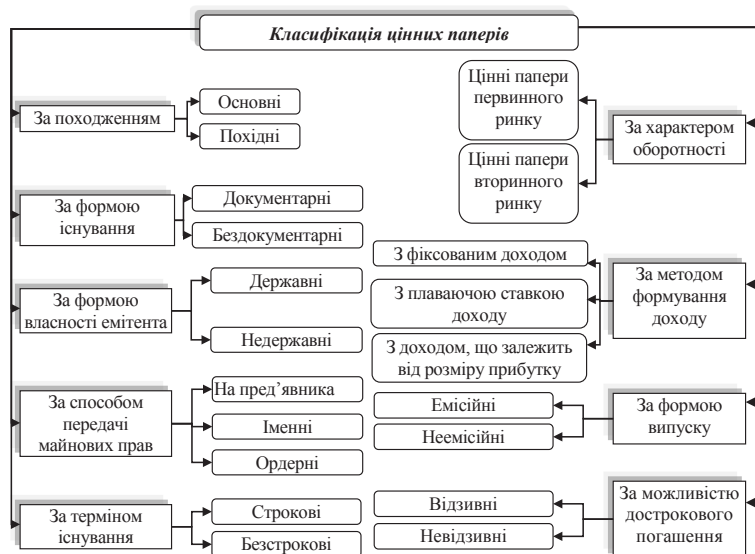
Рис. 1. Класифікація цінних паперів для цілей бухгалтерського обліку

Найбільш типовими видами цінних паперів, які випускаються і знаходяться в обігу на ринках цінних паперів різних