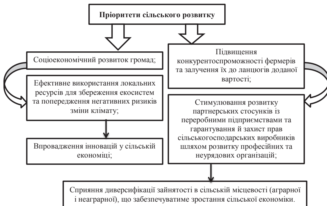
Рис. 3. Головні пріоритети сільського розвитку

– індекс реальної заробітної плати за 9 місяців 2018 р. до відповідного періоду минулого року склав 115,7% (2-е місце серед регіонів України) [10].