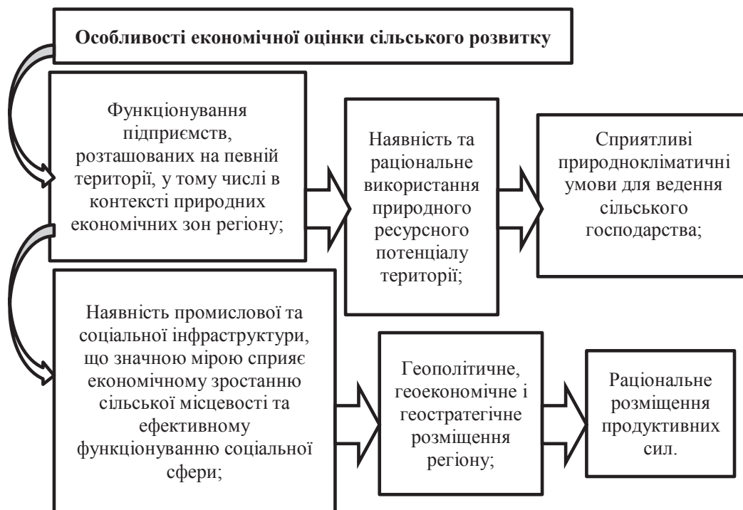
Рис. 1. Головні особливості економічної оцінки сільського розвитку

З метою подолання проблем розвитку сільських територій України, Кабінет Міністрів схвалив Концепцію Державної цільової програми сталого розвитку сільських територій на період до 2020 року. Метою Програми є забезпечення сталого розви-