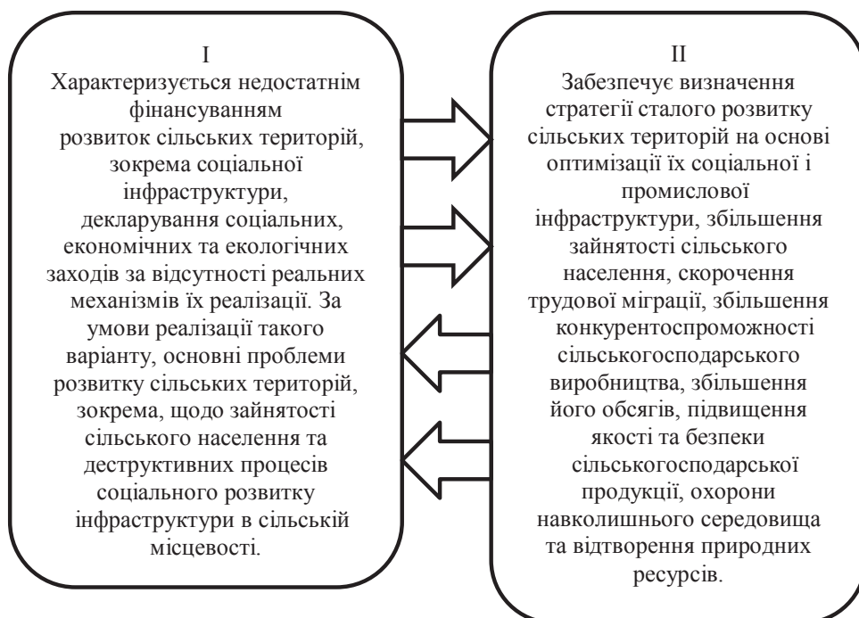
Рис. 2. Варіанти подолання деградації сільських територій

– доходи до бюджетів усіх рівнів від діяльності малих підприємств за 9 місяців 2018 р. до відповідного періоду минулого року зросли на 25,3%;