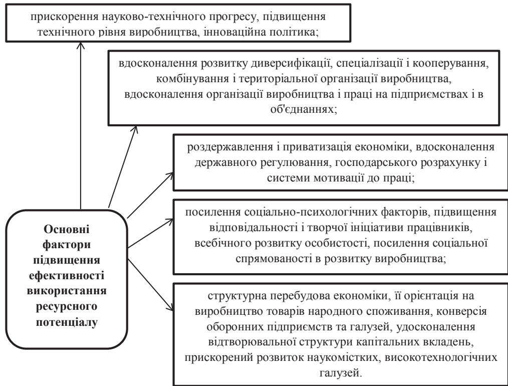
Рис. 3. Основні фактори підвищення ефективності використання ресурсного потенціалу