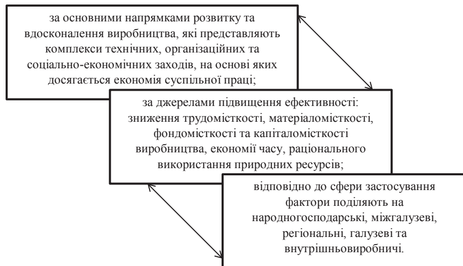
Рис. 4. Класифікація ознак підвищення ефективності ресурсного потенціалу