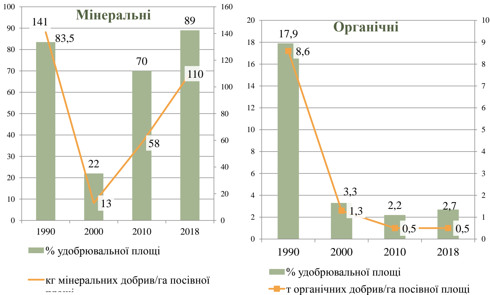
► Рис. 3. Структура внесення мінеральних та органічних добрив в Україні, 1990-2018 рр.