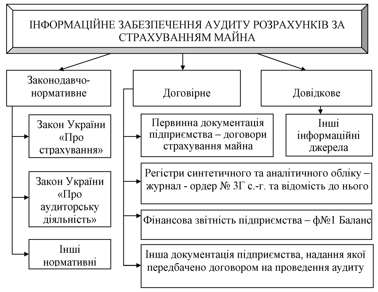
Рис. 4. Структура інформаційного забезпечення аудиту розрахунків за страхуванням майна

Окрім цього організаційне забезпечення може включати ще й здійснення ліцензування діяльності аудиторів. Що стосується теми дослідження, відобразимо інформаційне забезпечення аудиту розрахунків за страхуванням майна у вигляді рисунку 4.