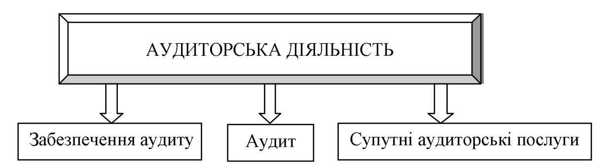
Рис. 1. Складові аудиторської діяльності

Інформаційне забезпечення аудиту — це систематизована сукупність достатньої та доречної інформації, яка може бути використана в процесі аудиту для досягнення поставленої мети та вирішення визначених завдань[2, 87].