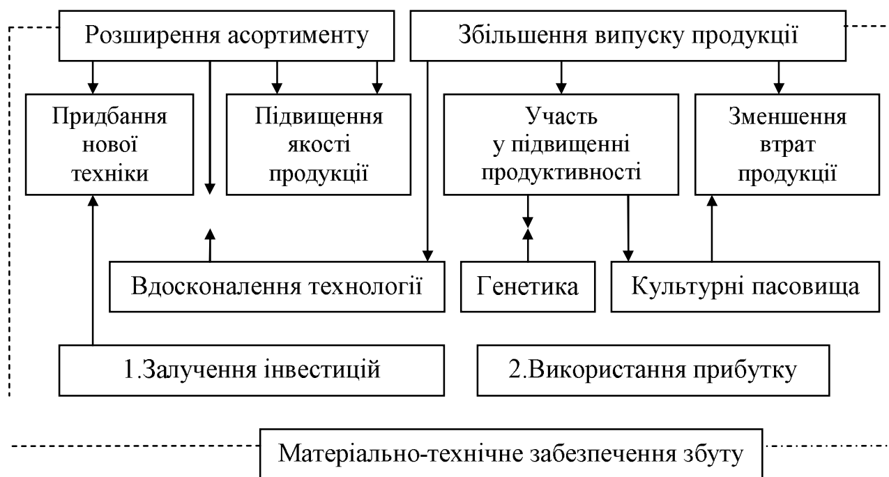
Рис.2. Основні цілі маркетингової стратегії АТВТ „Святошино”

Основні цілі АТВТ „Святошино” на найближчі три роки представлені на рис.2.