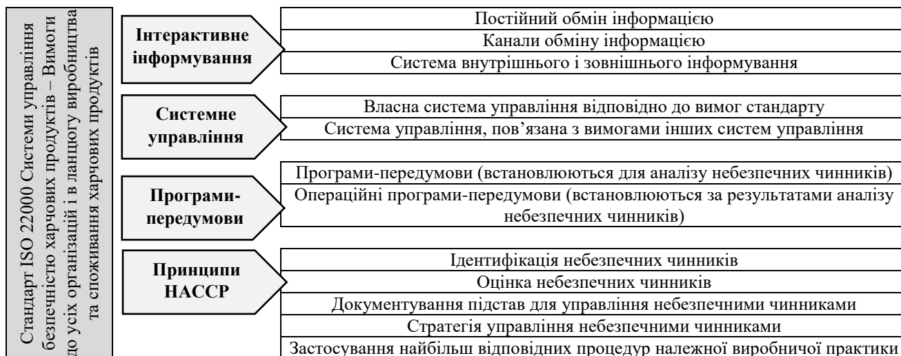
Рис. 2. Основні вимоги стандартів безпеки харчових продуктів

Аналогом НАССР є два стандарти Системи управління безпечністю харчових продуктів ДСТУ 4161-2003 та ISO 22000. Основні вимоги стандартів безпеки харчових продуктів наведені на рис. 2.