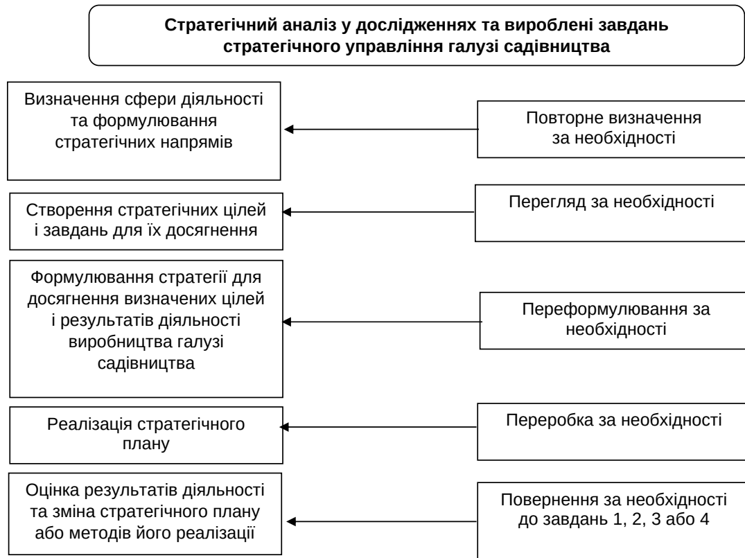
Рис. 6. Стратегічний аналіз у виробленні завдань стратегічного управління галуззю садівництва