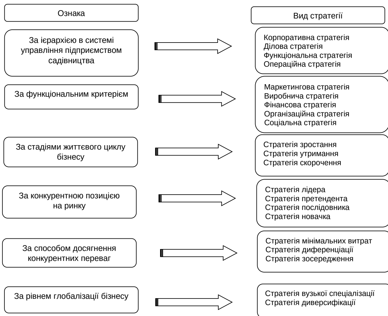
Рис. 3. Класифікація стратегій підприємств галузі садівництва

– створює передумови для формування такої системи управління, яка дає змогу функціонувати організації у стратегічному режимі, що забезпечує її існування в довгостроковій перспективі [25, с. 109–110].