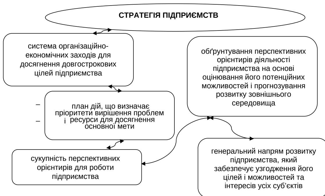
Рис. 1. Визначення терміна «стратегія підприємств»