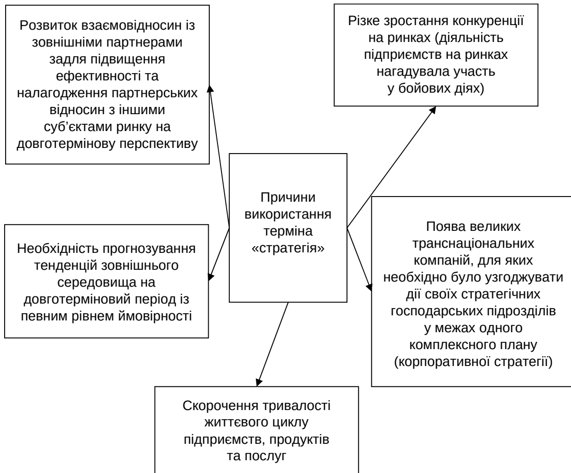
Рис. 4. Причини використання терміна «стратегія» у підприємницькій діяльності