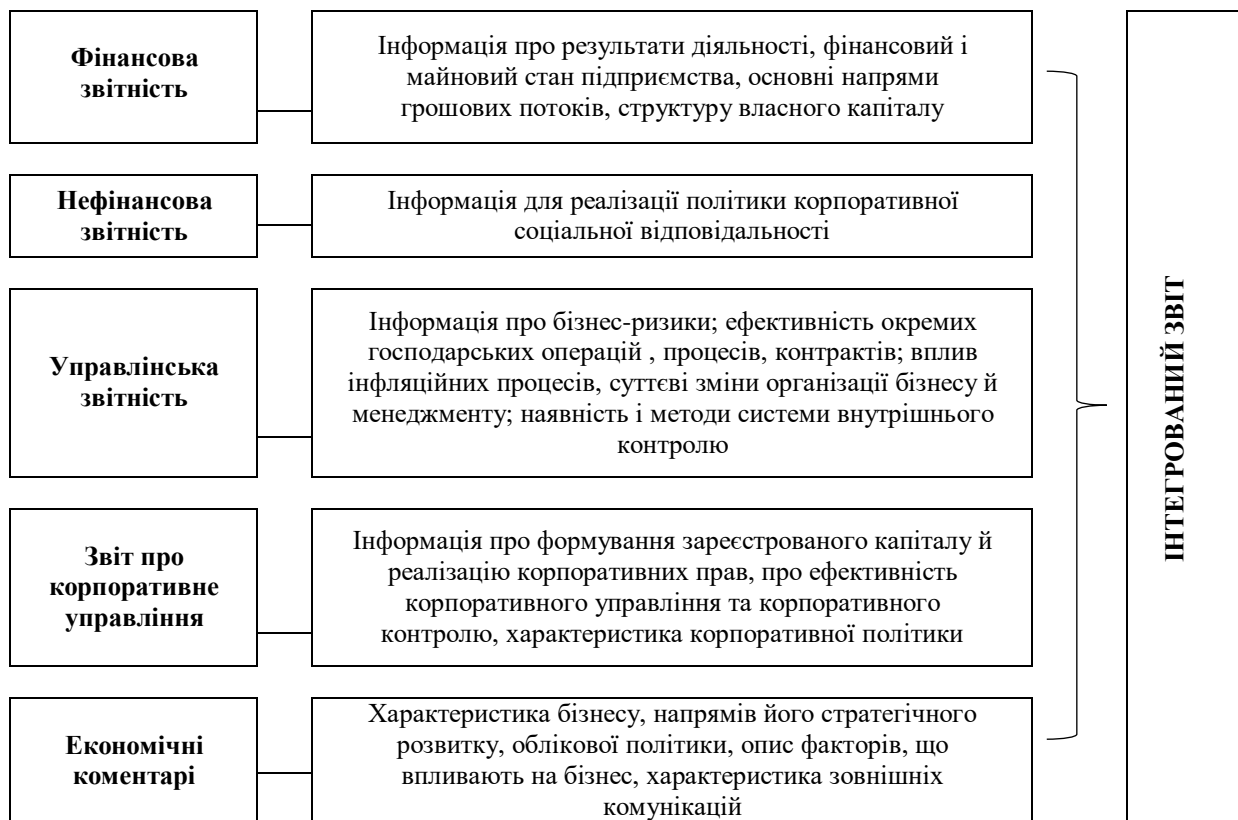
Рис. 3. Формування структури й змісту інтегрованої звітності

Формування інтегрованої облікової системи вимагає створення єдиного інформаційного простору, який забезпечить однократне введення даних екологічного, соціального, стратегічного й бухгалтерського обліку під час здійснення відповідних господарських операцій з метою обробки й перетворення інтегрованою обліковою системою в інформацію для потреб різних груп користувачів (як кроссекторальною робочою групою з формування інтегрованої звітності, так і обліковим персоналом для формування фінансової та податкової звітності чи управлінським персоналом для прийняття відповідних рішень) [10].