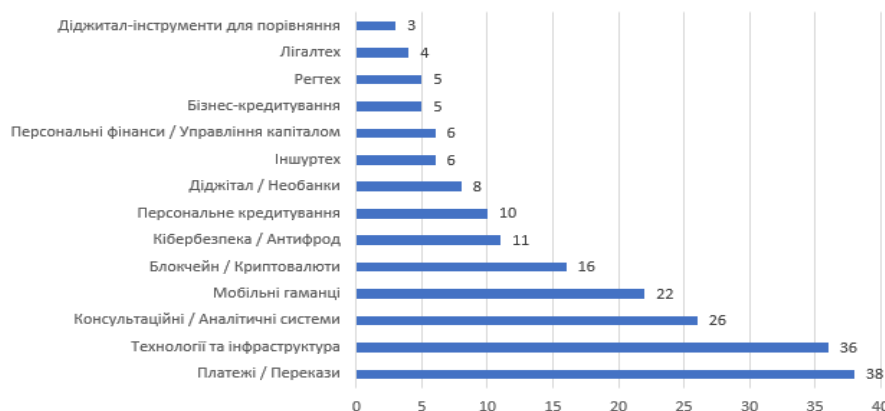
Рисунок 1. Розподіл фінтех-компаній за видами діяльності (кількість компаній)

В Україні електронні форми грошового обігу стали впроваджуватися дещо пізніше, ніж у розвинених країнах, можливо тому вони відразу ж мали «наліт» фінансових технологій – штучного інтелекту, Big Data, автоматизації роботизованих процесів (RPA), блокчейну та ін. А серед видів діяльності українських фінтех-компаній домінуючими стали ті, що якраз пов'язані із електронним обігом грошей (рис. 1).