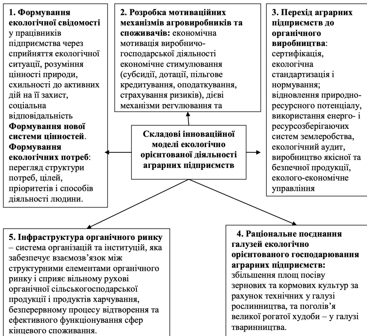
Рис. 1. Модель еколого-економічного механізму управління в аграрному виробництві

У сучасних умовах інноваційний розвиток аграрних підприємств можливий тільки на основі відповідної моделі, яка має враховувати регіональні особливості агропромислового виробництва та можливості інноваційного розвитку. Розвиток агропромислової інтеграції, що враховує економічні інтереси всіх її учасників, також сприяє забезпеченню інноваційного вектора розвитку агропромислових підприємств. На рис. 1 зображена модель еколого-економічного механізму управління в аграрному виробництві.