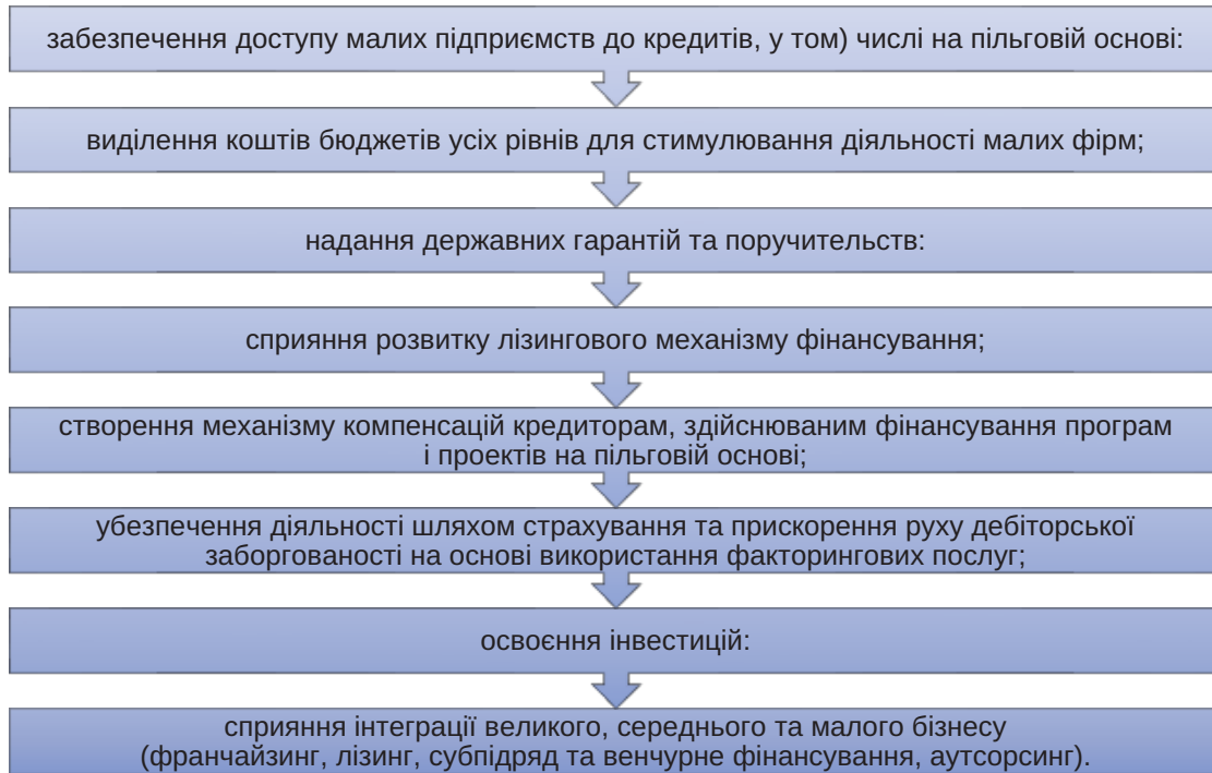
Рис. 2. Перший блок державної підтримки

Другий блок, що входить в систему державної підтримки, передбачає організаційне самовдосконалення цієї системи (рис. 3).