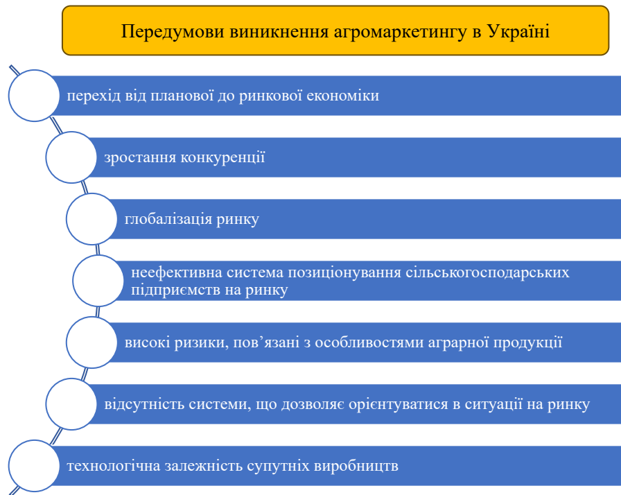
Рис. 1. Передумови виникнення агромаркетингу в Україні