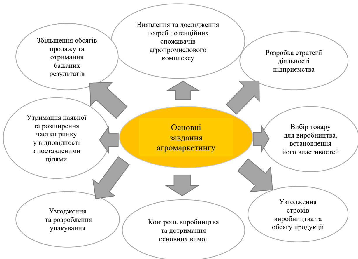
Рис. 3. Завдання маркетингу на агропідприємстві

Другою особливістю, яка повинна бути врахована в маркетинговій стратегії аграрного підприємства, є залежність від погодних умов. У аграрному секторі успішність виробництва і продажу продукції часто залежить від погодних умов. Тому аграрні підприємства повинні включати цей фактор у свій маркетинговий план і готуватися до можливих змін у виробництві та збуті продукції [13]. Наприклад, якщо підприємство вирощує фрукти, то воно повинно бути готове до мож-