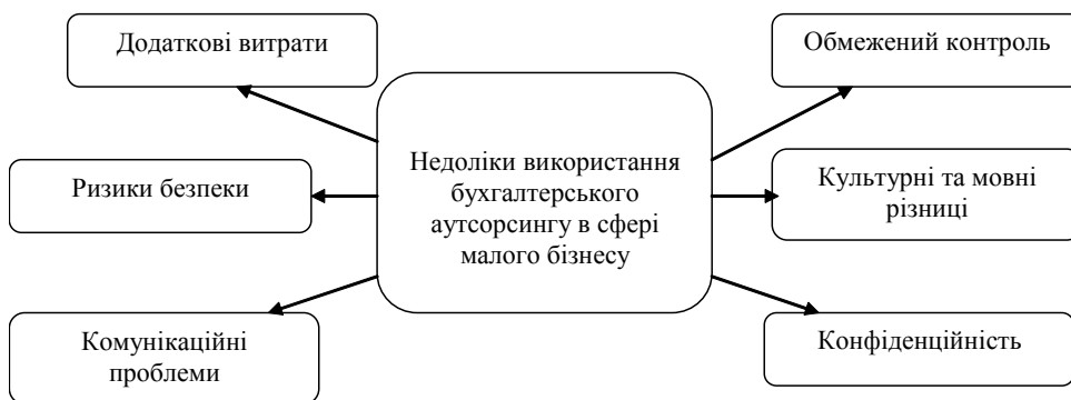
Рис. 4. Недоліки використання бухгалтерського аутсорсингу для малого бізнесу

У разі, коли підприємство передає свою бухгалтерію на аутсорсинг, воно передає повну