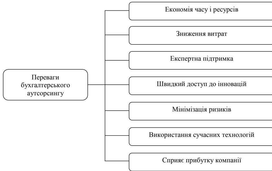
Рис. 3. Переваги бухгалтерського аутсорсингу для малого бізнесу