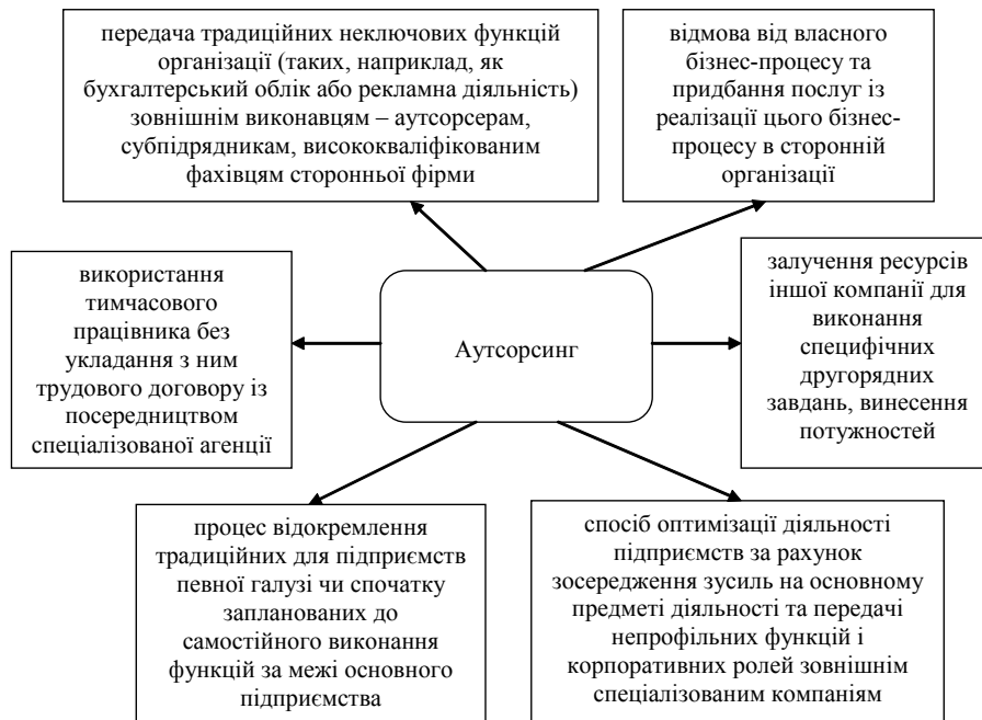
Рис. 1. Тракткування терміну "аутсорсинг"