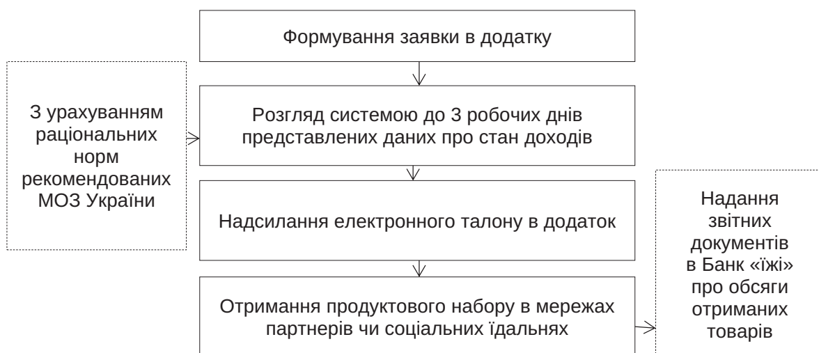
Рис. 2. Модель поширення електронних талонів через національний додаток «Дія»