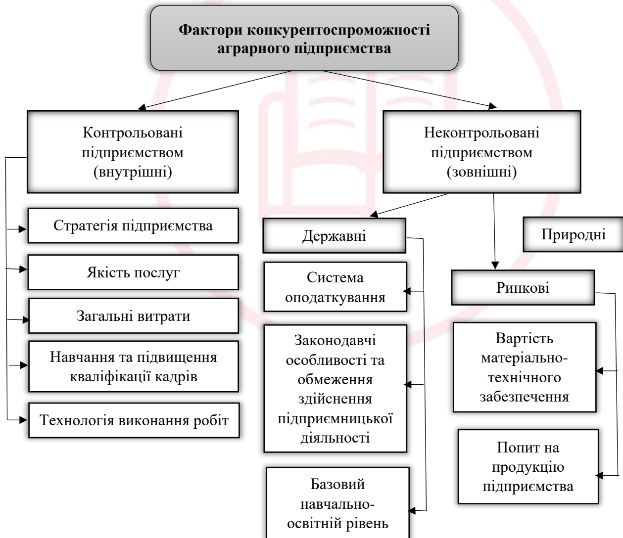
Рис. 2. Фактори конкурентоспроможності аграрного підприємства за джерелами їх утворення

Загалом систему факторів конкурентоспроможності аграрного підприємства можна схематично представити у вигляді рис. 2.