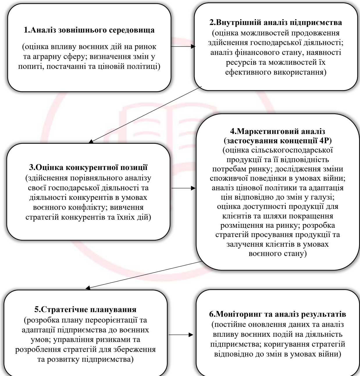
Рис. 4. Алгоритм оцінки конкурентоспроможності аграрних підприємств в умовах воєнного стану

В загальному вигляді, алгоритм може виглядати приблизно так (рис. 4):