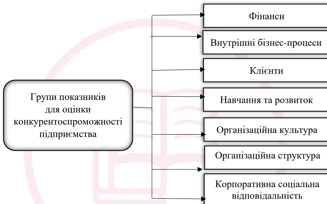
Рис.3. Групи показників оцінки конкурентоспроможності підприємства

Баглай І.Є. [10, с. 16], наголошує на тому, що для оцінки конкурентоспроможності підприємства необхідно скористатися такими групами показників: фінанси, внутрішні бізнес-процеси, клієнти, навчання та розвиток, організаційна культура, організаційна структура, корпоративна соціальна відповідальність (рис. 3). Варто зауважити, що всі запропоновані вченим блоки та їх показники можна вважати внутрішніми для підприємства, оскільки вони визначаються на основі результатів функціонування підприємства.