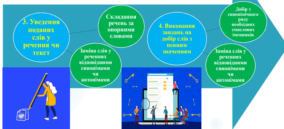
Рис. 2 (продовження). Напрями роботи й традиційні методи, їхні форми, що забезпечують розвиток лексичної компетентності у здобувачів вищої аграрної освіти