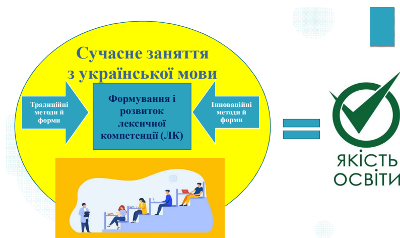
Рис. 1. Ілюстрована формула забезпечення якісного сучасного заняття з української мови у аграрному вищій