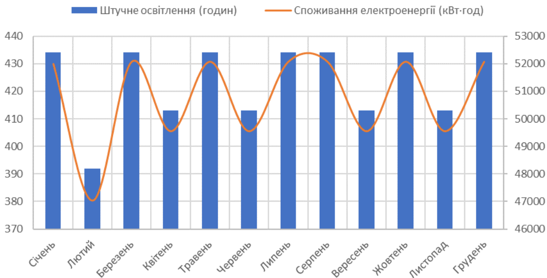
Рис. 2. Споживання електроенергії в гідропонічній теплиці впродовж року

Споживання електроенергії в гідропонічній теплиці значно варіюється в залежності від місяця року, проте загалом залишається на високому рівні протягом всього року. Освітлення є одним із основних факторів, що впливають на енерговитрати в гідропонічній теплиці, особливо при використанні штучного світла. Для зниження споживання електроенергії можна розглядати впровадження більш енергоефективних технологій освітлення та оптимізацію режимів роботи освітлювальних систем відповідно до фізіологічних потреб рослин.