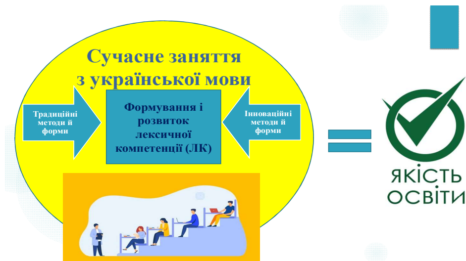
Рис. 1. Ефективна формула розвитку лексичної компетенції (ЛК) під час вивчення курсу “Українська мова та етнокультурологія” здобувачами аграрної вищої освіти

петенції на практичних заняттях з української мови потрібно активно застосовувати інноваційні методи, адже вони базуються на застосуванні нових інформаційних технологій, оволодіння якими є важливим складником освіти здобувачів (рис. 1).