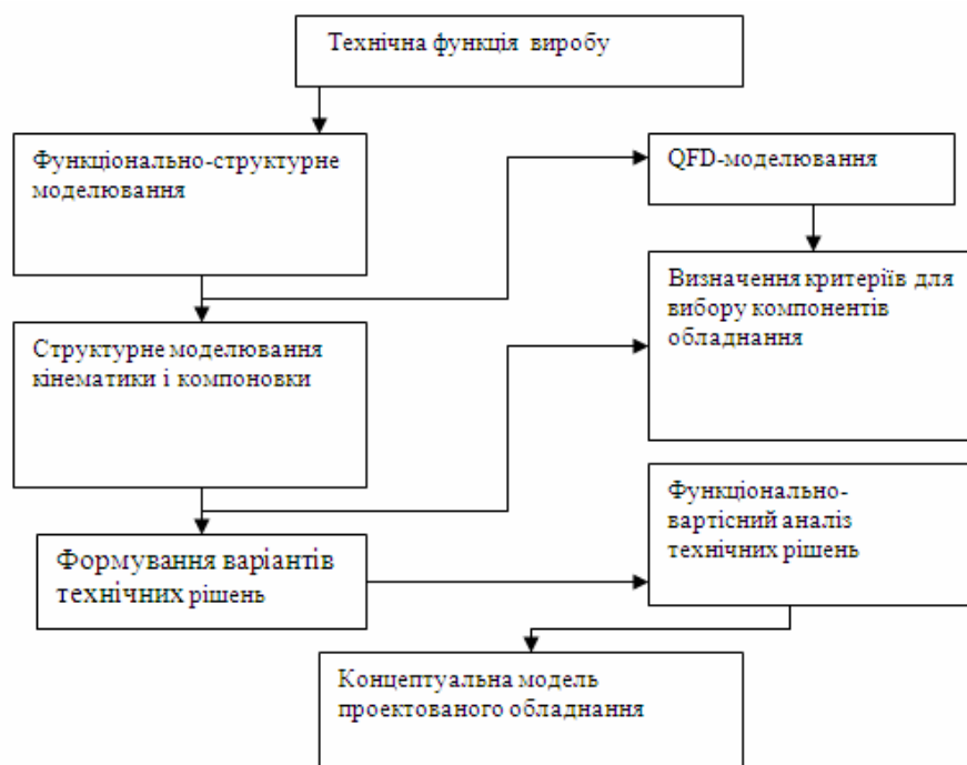
Рис.1. Загальна блок-схема концептуального моделювання виробу

використовувати т. н. QFD-метод (структурування функції якості). Застосування QFD-методу приводить до послідовного заповнення полів матриці погодження (рис. 3) споживчих вимог (СВ) і інженерних характеристик (ІХ) машини.