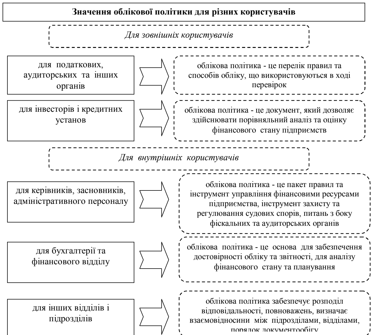
Рис. 2. Значення облікової політики для різних користувачів.

Виходячи з вказаних функції можна визначити значення облікової політики для різних користувачів (рис. 2):